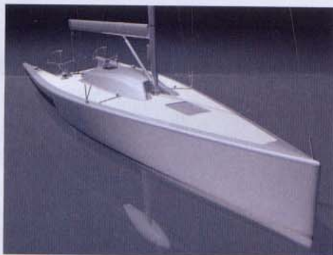
Sopra, il progetto dell'italiano Emanuele Rossi. A lato, quello dello studio Judel/Vroljik con lo specchio di poppa caratteristico di tutti i loro ultimi progetti.